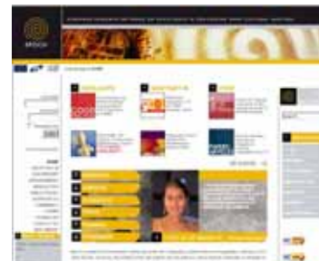
Pagina de start a sitului EPOCH

The second initiative concerns the on-line publication of the national movable cultural heritage objects inventory ( http://www.cimec.ro/scripts/PCN/Clasate/Clasate.asp ), a database containing more than six thousand entries sorted by location, type, period, etc. The database has a detailed search engine that allows a very efficient browsing in the database and easy retrieval of information. As a whole, Cimec’s website is a best practice model for the management of the cultural heritage at national level.”