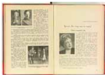
Articole din cuprinsul revistei "Teatru"

CIMEC a inițiat în ultimul an un proiect care va genera în timp, un anume confort profesional pentru toți cei interesați de studiu în domeniul teatral: