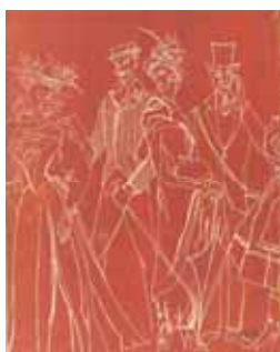
O copertă a revistei Teatru