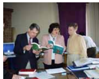
Stabilirea obiectivelor Proiectului "Atlasul Etnografic al României online"