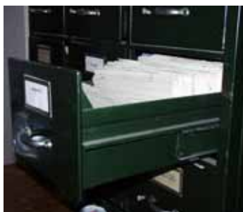
Arhiva Fișierului Central