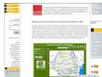
Pagina web a sitului EPOCH care apreciază activitatea CIMEC