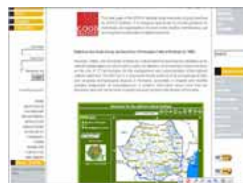
Pagina web a sitului EPOCH care apreciază activitatea CIMEC