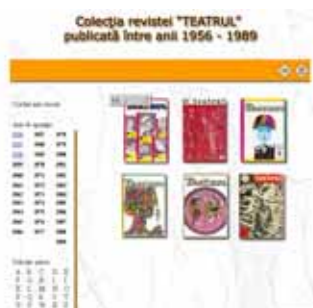
Pagina revistei "Teatru"