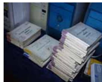
Chestionare tematice ale AER