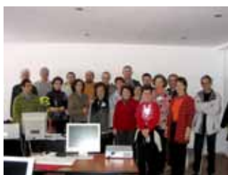
Participanți la cursul: informatizarea evidenței colecțiilor muzeale: Programul DOCPAT