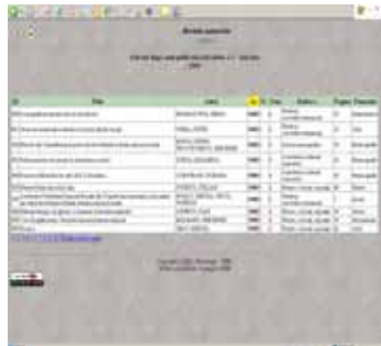
Baza de date a indicilor online -selecție după anul publicării-