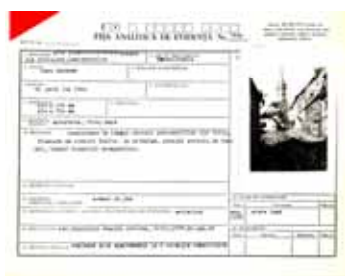
Fișă analitică de evidență