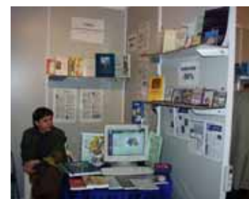
Standul CIMEC la Târgul Amplus - 2006

proiectele noastre. Considerăm astfel, că am primit încă o dată confirmarea receptării de către public a efortului CIMEC-ului de a participa la procesul de conservare și mai ales de diseminare a valorilor culturale patrimoniale naționale. Sperăm că și pe viitor demersurile și lucrările noastre vor fi la fel de apreciate de către un public și mai numeros.