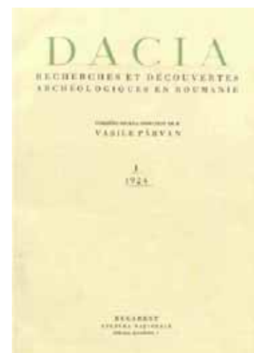
Coperta numărului 1 (1924) al revistei Dacia