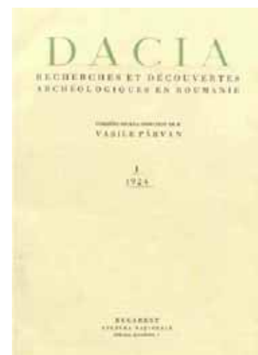
Coperta numărului 1 (1924) al revistei Dacia