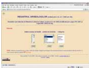
Pagina de start pentru registrul arheologilor

Institutul de Memorie Culturală împreună cu Direcția Generală Patrimoniu Cultural Național din cadrul Ministerului Culturii și Cultelor a inițiat un program de inventariere electronică a arhivei de fișe analitice de evidență și a fototecii bunurilor culturale mobile din patrimoniului cultural național. CIMEC deține un număr de circa 200.000 fișe analitice de evidență din toate domeniile, provenite de la instituțiile deținătoare de bunuri de patrimoniu mobil din țară, trimise pentru Fișierul Central al Patrimoniului Cultural Național în perioada 1975 - 1990. Inventarierea acestor fișe de evidență poate oferi rezultate interesante, chiar nebănuite în ceea ce privește valoarea calitativă și cantitativă a patrimoniului