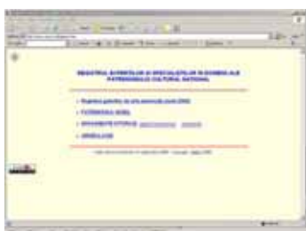
Pagina de start pentru registrele exepților de patrimoniu