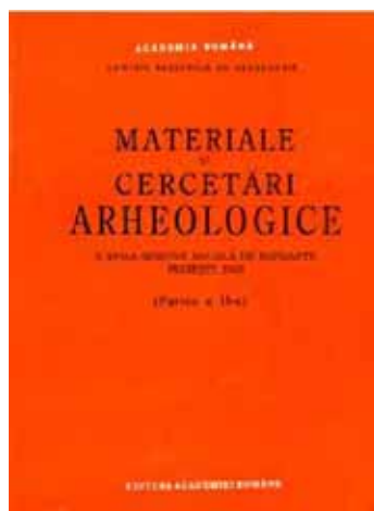
Coperta revistei "Cercetări și materiale arheologice"