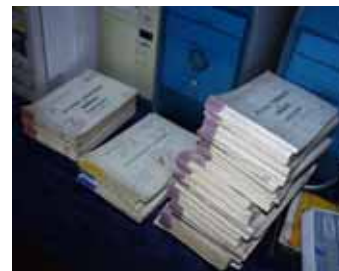
Chestionare tematice ale AER