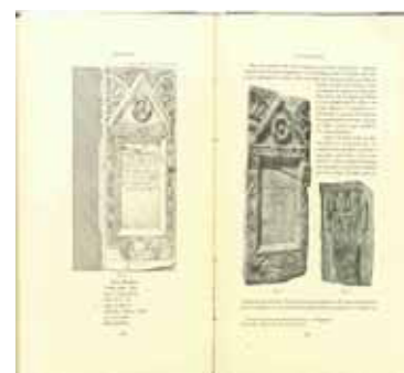
Articol din revista "Dacia"