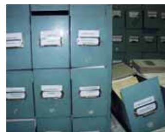
Fișier tematic al AER