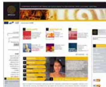
Pagina de start a sitului EPOCH

The second initiative concerns the on-line publication of the national movable cultural heritage objects inventory ( http://www.cimec.ro/scripts/PCN/Clasate/Clasate.asp ), a database containing more than six thousand entries sorted by location, type, period, etc. The database has a detailed search engine that allows a very efficient browsing in the database and easy retrieval of information. As a whole, Cimec’s website is a best practice model for the management of the cultural heritage at national level.”