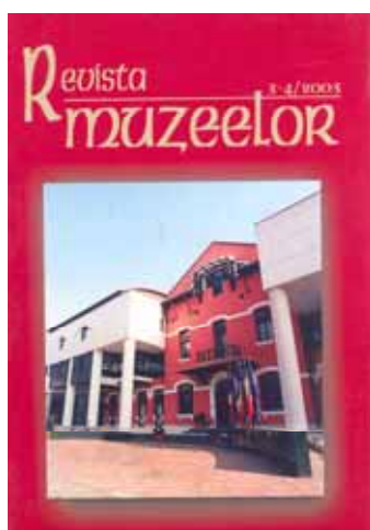
Copertă a Revistei Muzeelor